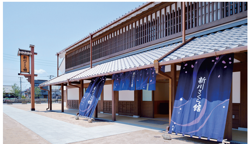
新川さくら館 (7月オープン)

この定例会の会議録は、9月上旬にできあがりません。詳細は、区議会ホームページ、お近くの図書館、コミュニティ図書館、または区議会事務局をご覧ください。